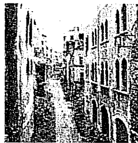
Gabriele Basilico, «Beirut», 2006

La stampa ai sali d'argento (6 di 15) del fotografo è stata battuta da Sotheby's il 27 maggio 2008 al prezzo di martello di 6.500 euro con un diritto di seguito di 260 euro che non è stato riscosso