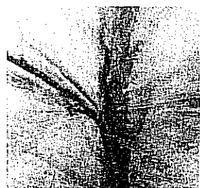
Piotr Uklanski «Untitled (zoom tree)», 1997

La foto su alluminio (ed 5 + 1pa) è stata battuta da Sotheby's il 26 novembre 2009, a 3.500 euro (prezzo di martello), ed ha un diritto di seguito pari a 140 euro non riscosso