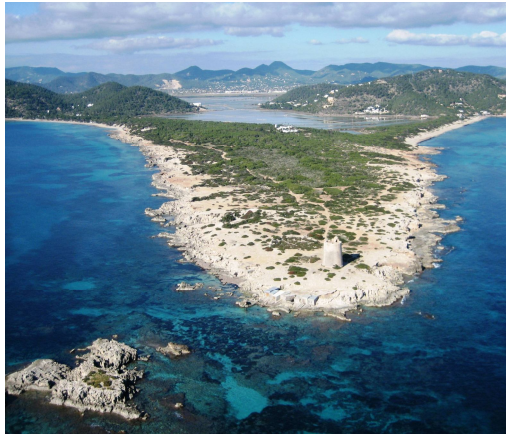
Penisola di Salinas - Ibiza

Lui era lì, anche quando per scommessa con me stesso anticipavo di un'ora il risveglio e partivo a notte, lui era sulla panchina. Gli occhi chiarissimi sotto due boschi di sopracciglia, pantaloni scuri, una camicia senza collo e gilet grigio e nero.